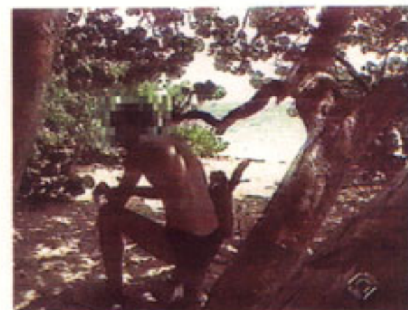
»Born-Fake«: Inszenierter »Drogenkurier«.

Mit der Digitalisierung der Fotos sind der Veränderung und damit der Fälschung und Täuschung Tür und Tor geöffnet. Es mag bei der Regenbogenpresse noch angehen, Lady Di eine dicke Träne auf die Wange zu generieren. Aber sogar der Branche ging die digitale Kindsunterschlebung am Hof von Monaco zu weit: Die Bunte vom 10. Dezember 1992 enthüllte, daß auf zwölf Titelbildern von verschiedenen Illustrierten der Yellow Press das Baby Prinzessin Stéphanies jedesmal ein anderes war. Nicht der hingebungsvolle Leibwächter war da der Vater, sondern der jeweilige digitale Bilderzeuger oder – je nach technischem Stand – der konventionelle Foto-