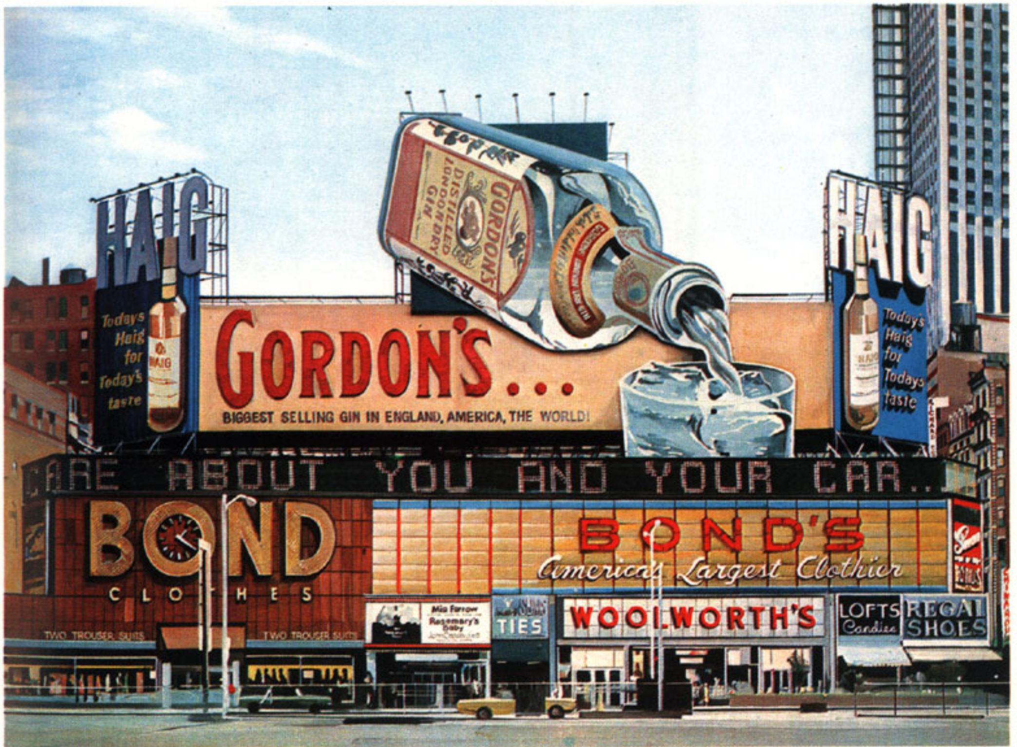
Unsere Umwelt, eine Bildumwelt. Richard Estes, Gordon's Gin.

bilderstürmerische Reflexe haben in unserer Kulturgeschichte ihre Vorläufer, zuletzt während der Reformation. Im zwinglianischen Zürich und im calvinistischen Genf wurden Bilder nicht nur aus Kirchen verbannt; auch in den privaten vier Wänden war bildlicher Wandschmuck verpönt. Ein Bild galt als obszön, weil es ein Bild war, unabhängig davon, was es darstellte.