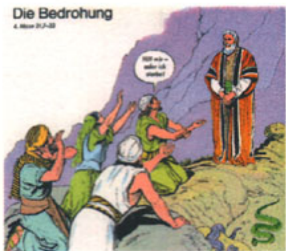
Comics und Fernsehen: Armenbibeln des 20. Jahrhunderts?

Noch konsequenter setzte der Islam das Bilderverbot durch. Es gibt zwar auch figürliche Darstellungen, aber im großen und ganzen wählte die islamische Kunst einen nicht-gegenständlichen (Aus-)Weg: den ornamentalen.