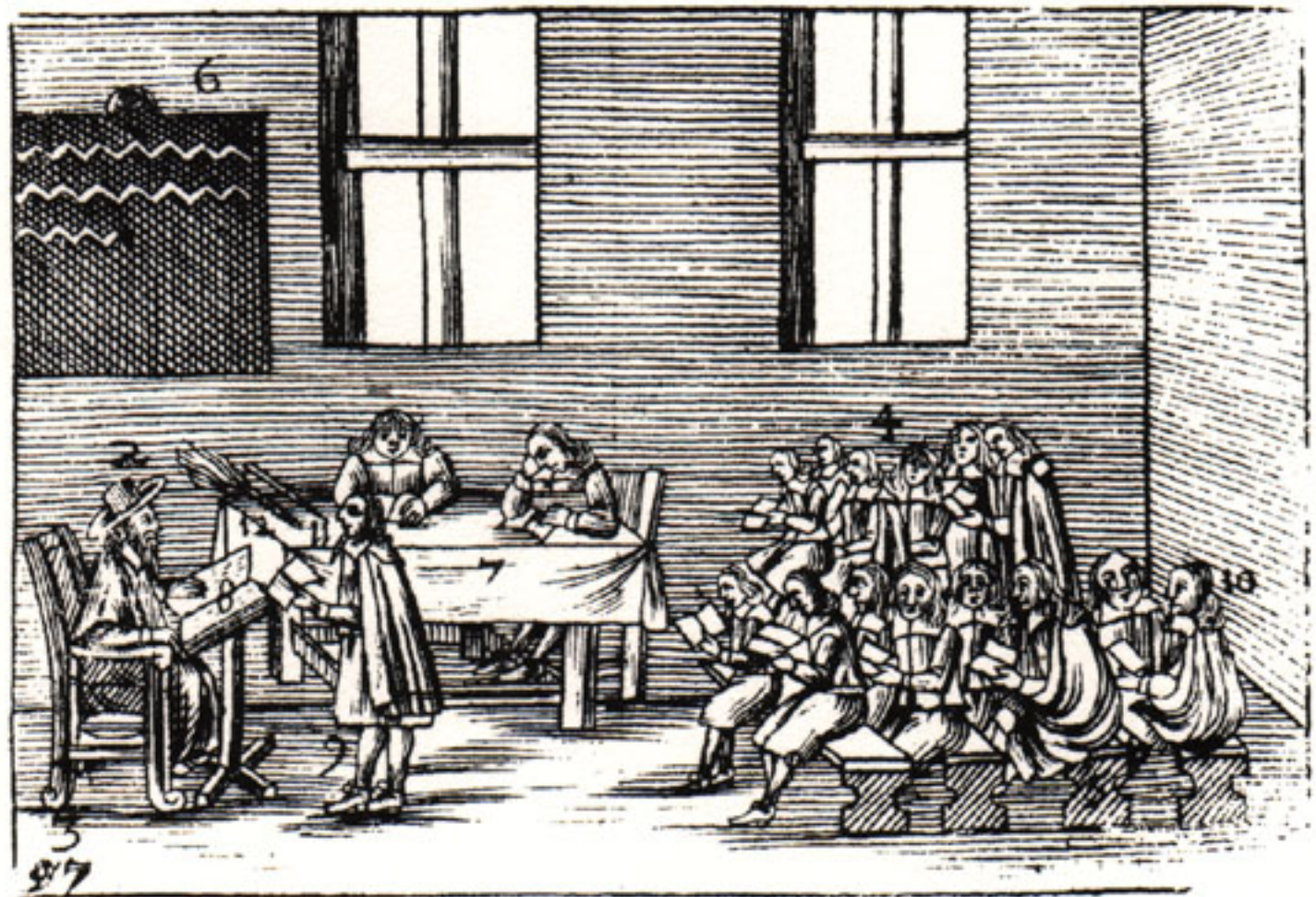
Comenius. »Die Schul«. Das Bild der Schule: bildlos.

herrschaft des Buches. Gerade wegen der heutigen Bilderflut müsse das Lesen (gemeint von Worttexten) stärker gefördert werden, lautet eine buchfundamentalistische Forderung. Die Schule – wo Bildmedien weitgehend mit Freizeitmedien konnotiert werden – reagiert auf die Herausforderung des »optischen Zeitalters« (Pawek 1963) größtenteils mit Abwehr: Wegen der Bilderflut beschränkt sie sich auf die Schriftlichkeit. Dabei erkennt man das damit verbundene politische Risiko nicht: Denn wenn die Schule einseitig nur zum Lesen von gedruckten Texten befähigt, werden die zukünftigen Bürgerinnen und Bürger, die sich ausschließlich aus den elektronischen Medien informieren, nicht für deren adäquate Nutzung qualifiziert sein. So ist die Schule noch immer die Institution des geschriebenen und gedruckten Wortes geblieben, wie sie Johan Amos Comenius auf dem Tafelbild in seinem Orbis sensualium pictus darstellte. Übt der große Ahnherr des Anschauungsunterrichts, der in gültiger Form das Bild in die Didaktik einführte, mit dieser Illustration an der Schule Kritik oder beschrieb er einfach die gängige Praxis?