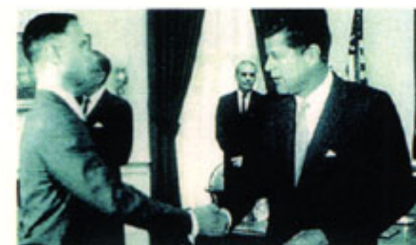
... Präsident Kennedy begrüßt den Nicht-Zeitgenossen Tom Hanks.