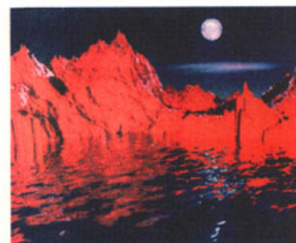
Die Wirklichkeit, die aus dem Computer kam: Rote Felsen ...