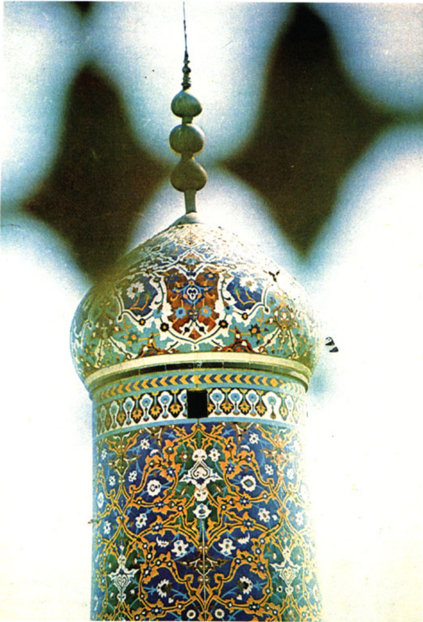
Bilderverbot im Islam: Ausweichen in das Ornament.

die Bildmedien und setzen die mittelalterlichen Bilderstürme in der modernen Version der Bilderverachtung fort.