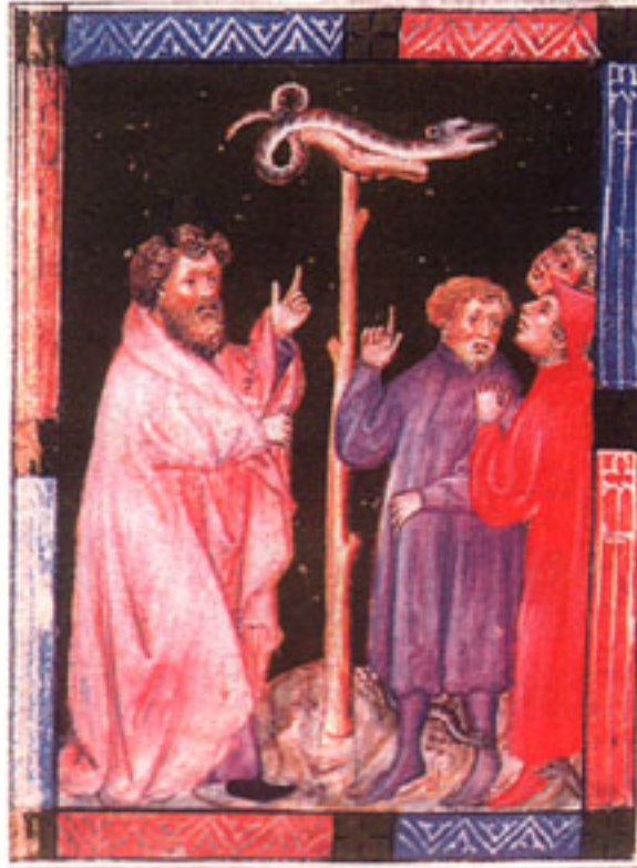
Armenbibel: Bibel für die »armen« Nichtalphabetisierten.