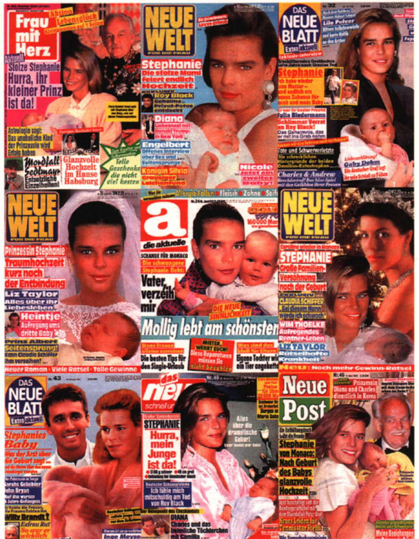
Elektronische Kindsunterscheidung am monegasischen Hof: Familienbilder bereits vor der Geburt.

monteur. Nun ist in der Regenbogenpresse auch der Wortjournalismus nicht zimperlich. Offenbar ist dort, wie Michael Haller (1993) darlegt, das Faking , das Erfinden von Nachrichten, gang und gäbe. Die kühnsten Statements werden Prominenten in den Mund gelegt und Anwaltspraxen mit den Klagen von Geschädigten in Atem gehalten. Wo beginnt der Sündenfall – bei der computergenerierten königlichen Träne, die als ihre Vorgängerin die Glycerinträne des Spielfilms geltend machen kann, oder bei inhaltlichen Entstellungen und Kompromittierungen?