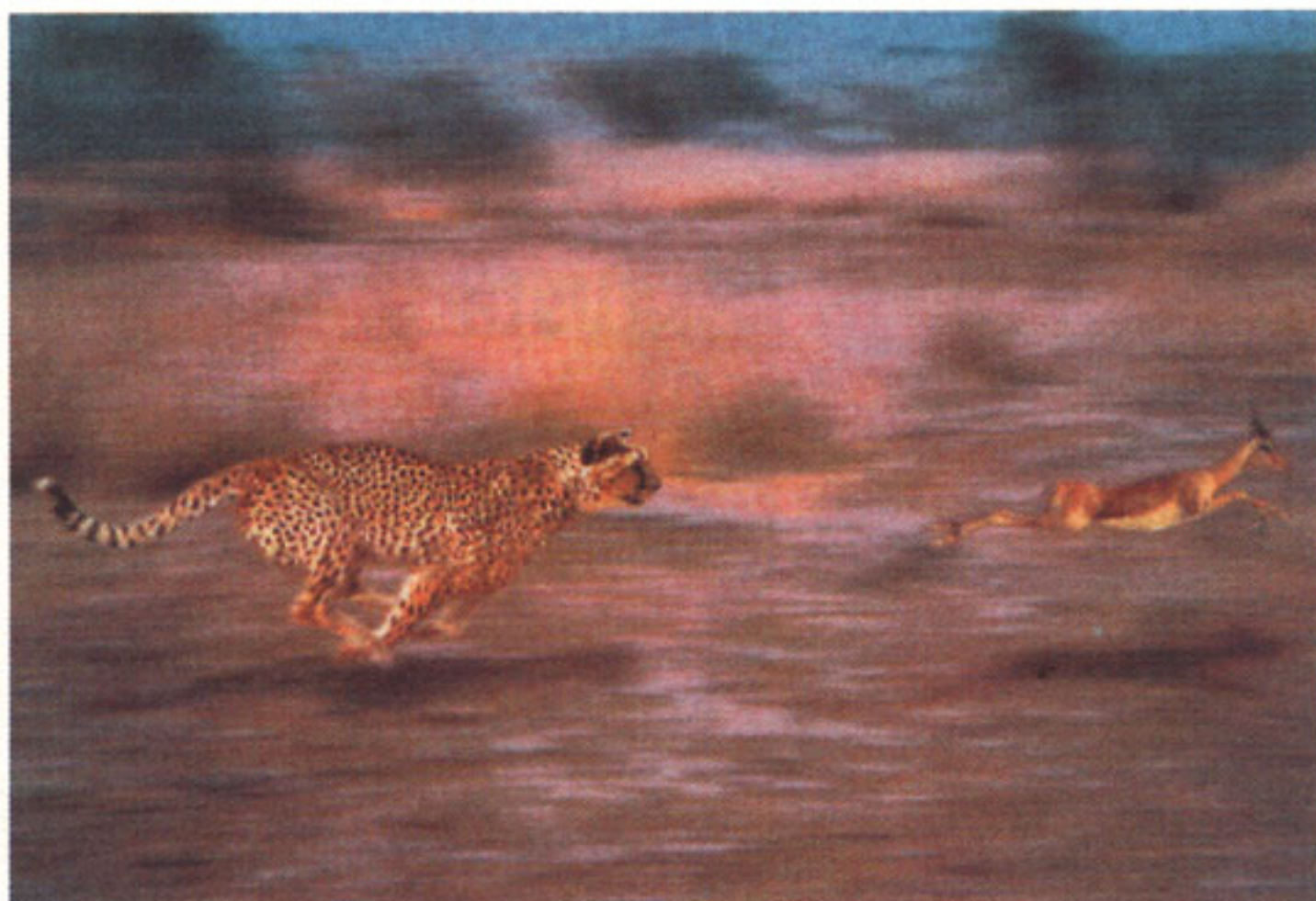
Aus sechs mach eins: Sowohl die Jagdszene wie der Gepard selbst sind aus mehreren Bildern zusammengesetzt.

Tierfotograf Steve Bloom bietet das Bild eines Gepards an, der eine Impala-Antilope jagt. Der Gepard ist in einer Aufzuchtstation und die Impala-Antilope im Krüger-Nationalpark in Südafrika fotografiert worden. Der jagende Gepard wurde aus drei verschiedenen Bildern zusammengesetzt und am Bildschirm zu seiner endgültigen Form »gezogen«.