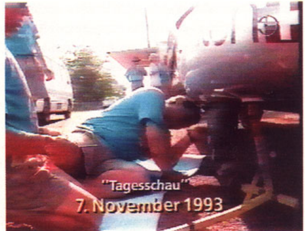
Die Bilder von gestern zur Illustration der Ereignisse von heute.

Alarmierender ist, wenn Fernsehstationen mit Archivmaterial sorglos umgehen, wie der französische Fernsehjournalist Albert du Roy rügte: »Der Aufruhr in Algerien wird illustriert durch Reportagen, welche bei Demonstrationen vor mehreren Monaten gemacht worden waren; die Hungersnot im Sudan durch Aufnahmen der Hungersnot vom Vorjahr; die letzte irakische Operation gegen die Kurden durch die Bilder einer früheren militärischen Aktion. Freilich ist oft, wenn auch nicht immer, ein flüchtiger Einblender ›Archivbild‹ in einer Ecke des Bildschirms zu sehen. Reicht indessen eine solche diskrete Erwähnung aus, um unseren unbändigen und undifferenzierten Bilderkonsum zu beeinflussen?« (du Roy 1992, 192).