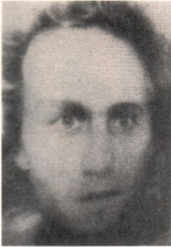
Der Computer macht's möglich: Umkodierung eines konventionellen Bildes von Mozart zur »Fotografie«.

monteur. Nun ist in der Regenbogenpresse auch der Wortjournalismus nicht zimperlich. Offenbar ist dort, wie Michael Haller (1993) darlegt, das Faking , das Erfinden von Nachrichten, gang und gäbe. Die kühnsten Statements werden Prominenten in den Mund gelegt und Anwaltspraxen mit den Klagen von Geschädigten in Atem gehalten. Wo beginnt der Sündenfall – bei der computergenerierten königlichen Träne, die als ihre Vorgängerin die Glycerinträne des Spielfilms geltend machen kann, oder bei inhaltlichen Entstellungen und Kompromittierungen?