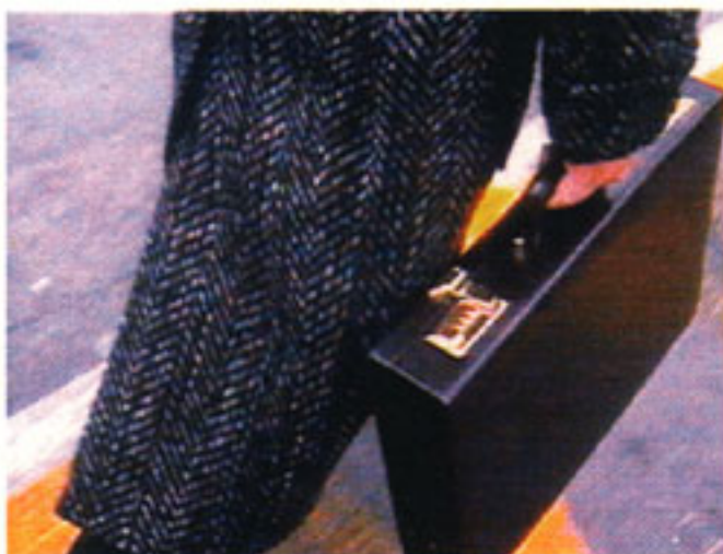
Fernsehbilder aus dem elektronischen Schnippelbuch: Der Mann mit dem Koffer (links DRS, Mitte und rechts ARD).

Im Zug der Boulevardisierung des Fernsehens werden zunehmend auch Ereignisse gestellt (vgl. Thalmann 1994). In einer Tagesschau -Meldung über Wirtschaftskriminalität in der Schweiz taucht ein Mann mit Koffer auf, der zielstrebig durch eine Drehtür zu einem Bankschalter eilt und dort